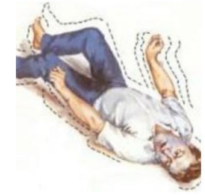
يوجد شخص مصاب بنوبة مرضية.