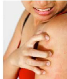
أصبت بطفح جلدي بسيط لا يختفي.