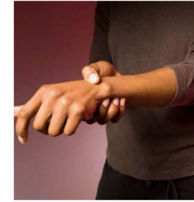
أصبت بكسر في العظام.