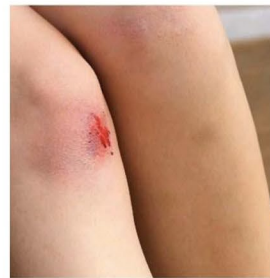
أصبت بجرح خفيف. الحل: ضع ضمادة عليه.