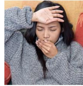
أصابتك حمى لمدة يومين أو أكثر.