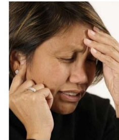
تشعر بألم شديد في الأذن أو الرأس لأيام عديدة..