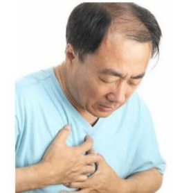
شعر بألم في صدرك أو قلبك. تشعر بخدر في ذراعك الأيسر. لا تستطيع أن تتنفس.