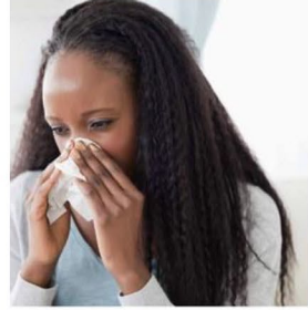
أصابك ارتشاح في الأنف أو برد.