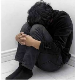
أصابك شعور بالحزن واليأس لأيام عديدة.