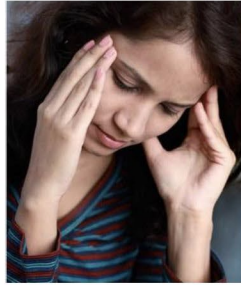
أصابك صداع خفيف. الحل: تناول مسكناً.