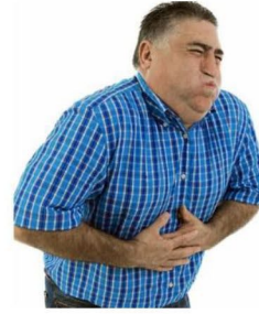
أصابك شعور بالغثيان لأيام عديدة.